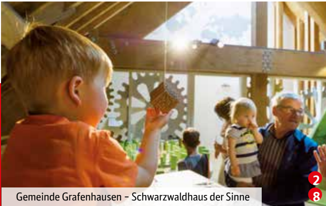
Gemeinde Grafenhausen – Schwarzwaldhaus der Sinne