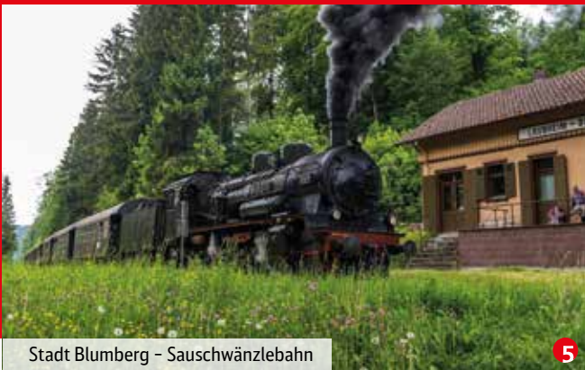
Stadt Blumberg – Sauschwänzlebahn