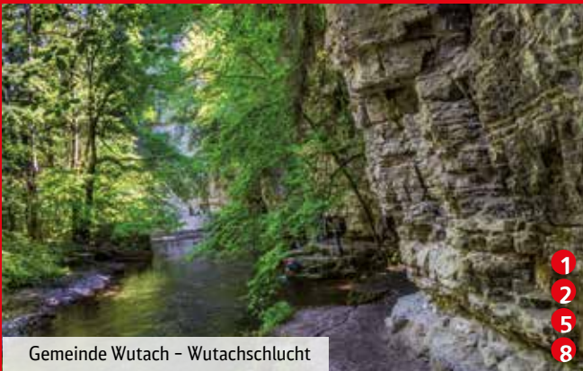
Gemeinde Wutach - Wutachschlucht