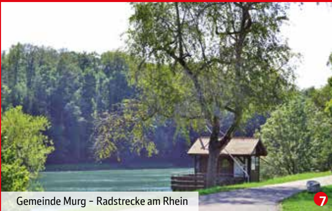
Gemeinde Murg – Radstrecke am Rhein