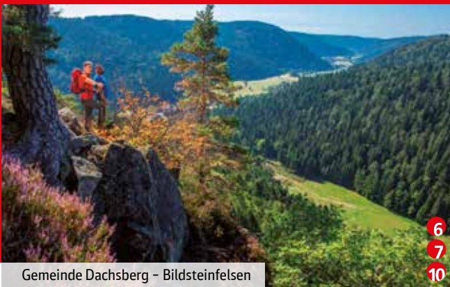
Gemeinde Dachsberg – Bildsteinfelsen