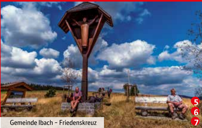
Gemeinde Ibach – Friedenskreuz