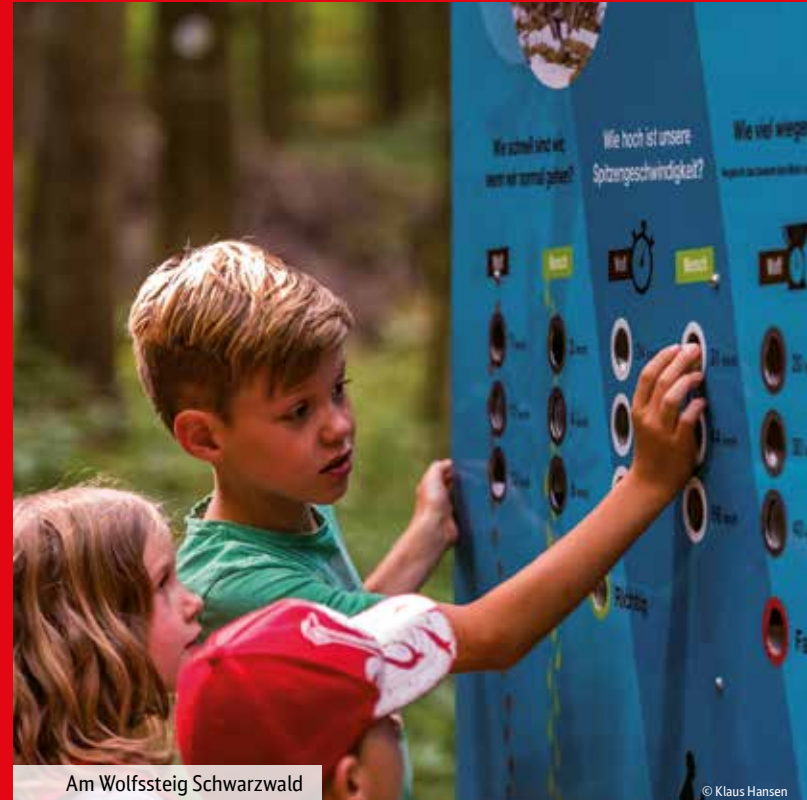
Am Wolfssteig Schwarzwald