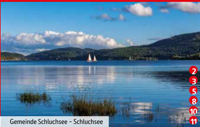
Gemeinde Schluchsee – Schluchsee