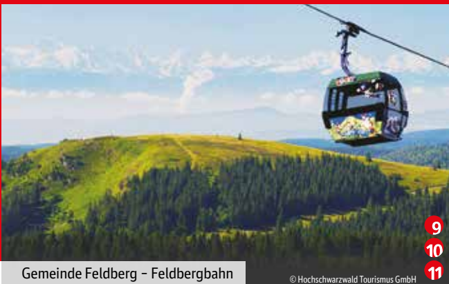
Gemeinde Feldberg – Feldbergbahn

Uralte Schwarzwaldhäuser, kühle Bachläufe, grasende Hinterwälder-Rinder und wunderschöne Pfade. Das macht die großartige Land-schaft des Hochschwarzwaldes mit seinen abwechslungsreichen Tälern aus. Mit dem Wanderbus Hochschwarzwald haben Sie zahlreiche und vielseitige Möglichkeiten, Ihren Sonn- und Feiertagsausflug zu gestalten.