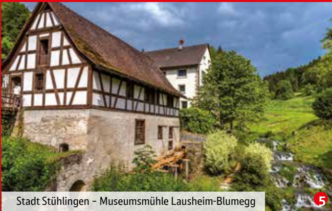
Stadt Stühlingen – Museumsmühle Lausheim-Blumegg