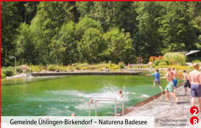
Gemeinde Ühlingen-Birkendorf – Naturena Badesee