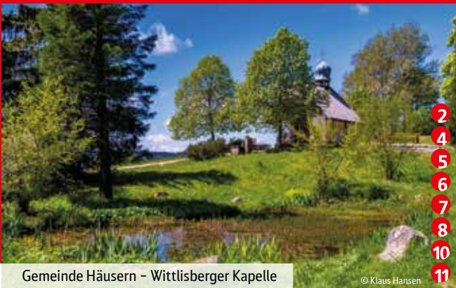
Gemeinde Häusern - Wittlisberger Kapelle