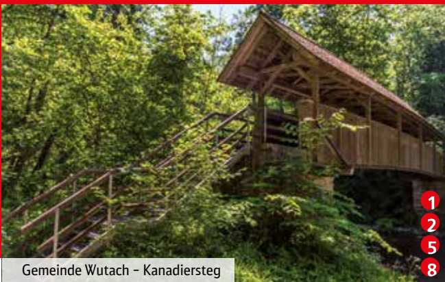
Gemeinde Wutach - Kanadiersteg