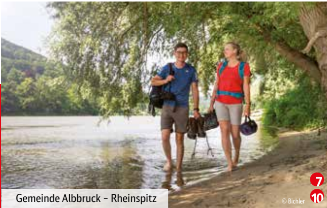
Gemeinde Albrück – Rheinspitz