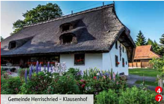
Gemeinde Herrischried - Klausenhof