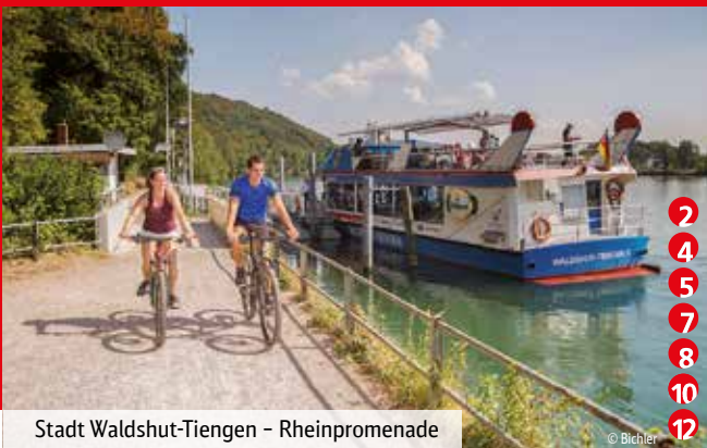
Stadt Waldshut-Tiengen - Rheinpromenade