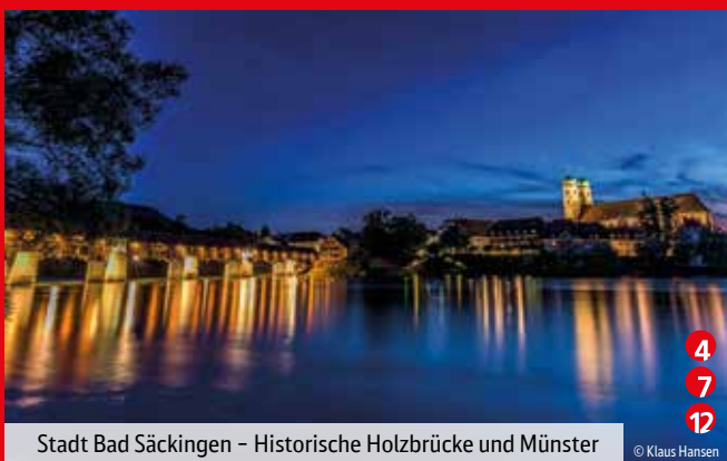
Stadt Bad Säckingen – Historische Holzbrücke und Münster