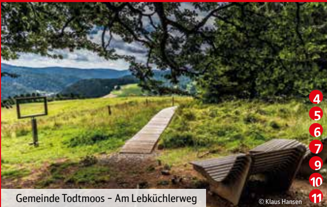
Gemeinde Todtmoos – Am Lebküchlerweg