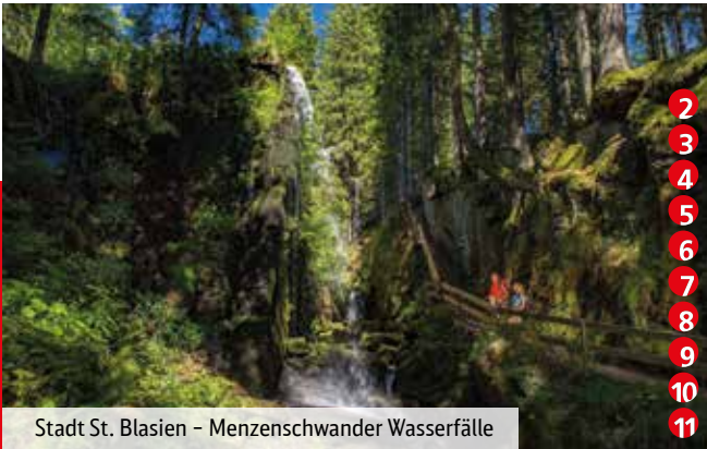
Stadt St. Blasien – Menzenschwander Wasserfälle