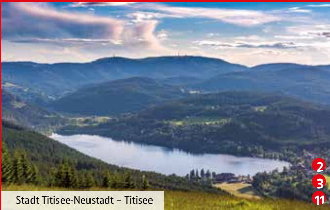
Stadt Titisee-Neustadt - Titisee