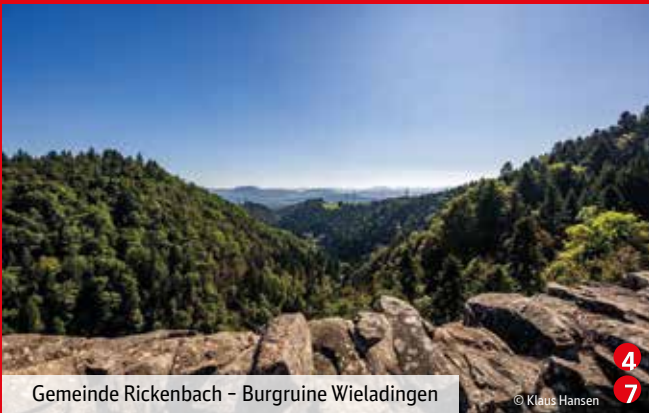
Gemeinde Rickenbach - Burgruine Wieladingen