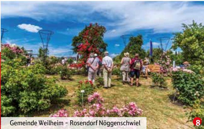
Gemeinde Weilheim – Rosendorf Nöggenschwil