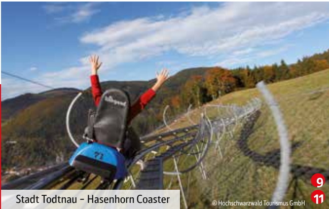
Stadt Todtnau - Hasenhorn Coaster