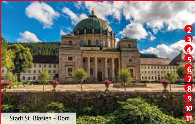
Stadt St. Blasien – Dom