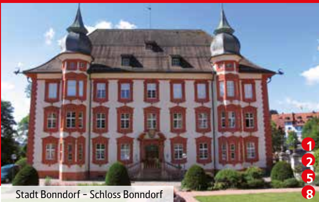
Stadt Bonndorf – Schloss Bonndorf

Die Badeseen Schluchsee, Schluchtsee und Naturena, das historische St. Blasier Land , tiefe Schluchten, historische Gebäude und Museen bieten unvergessliche und interessante Ausflüge.