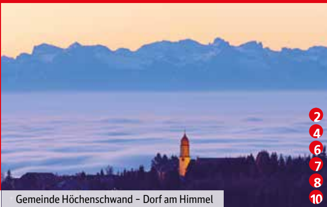
Gemeinde Höchenschwand – Dorf am Himmel

Nutzen Sie diese Rundtouren auch zum spontanen Erkunden verschiedenster Orte. Sobald Ihnen ein Ort besonders gefällt, können Sie einfach aussteigen und die nächsten Verbindungen zur Weiterfahrt nutzen.