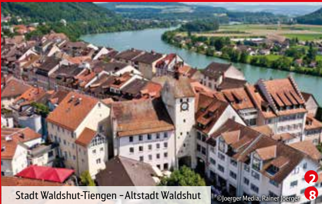
Stadt Waldshut-Tiengen – Altstadt Waldshut