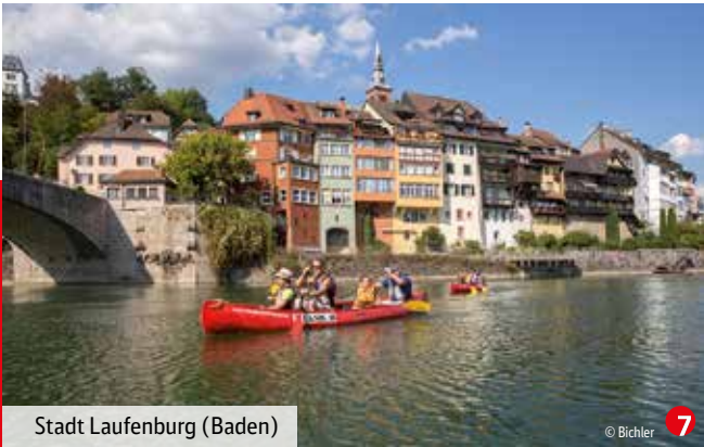
Stadt Laufenburg (Baden)