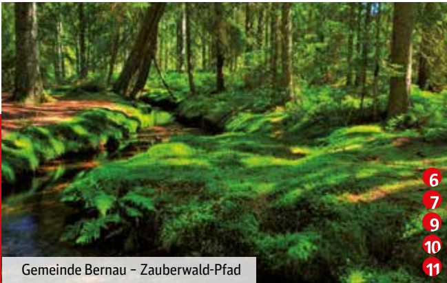
Gemeinde Bernau – Zauberwald-Pfad