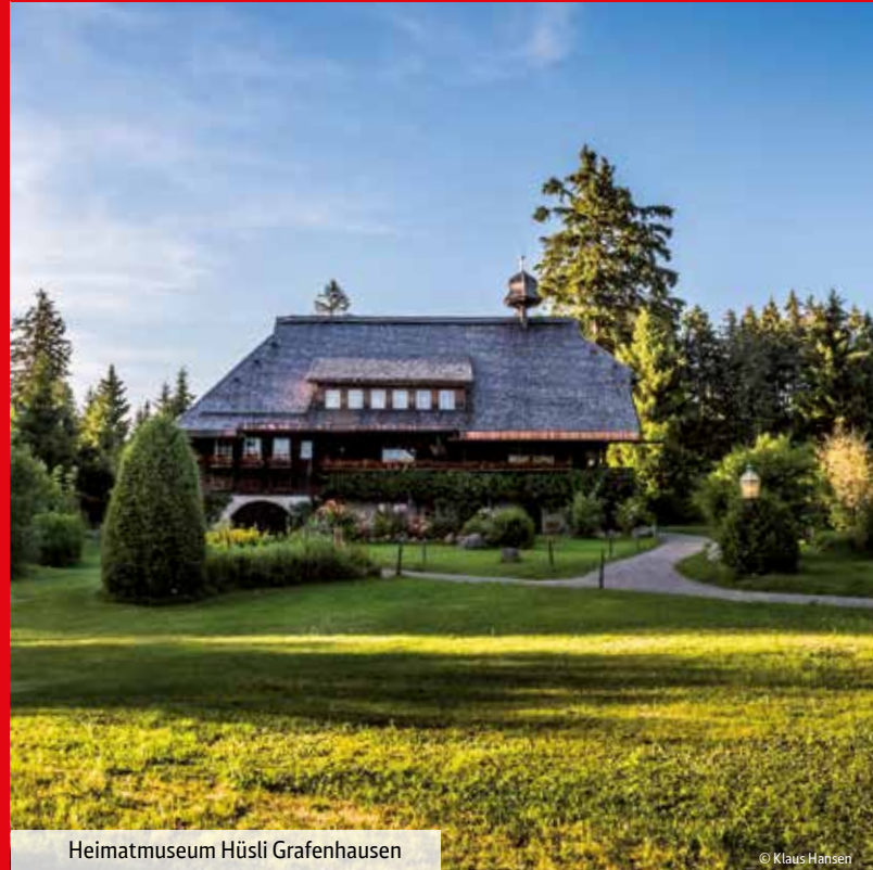
Heimatmuseum Hüslli Grafenhausen