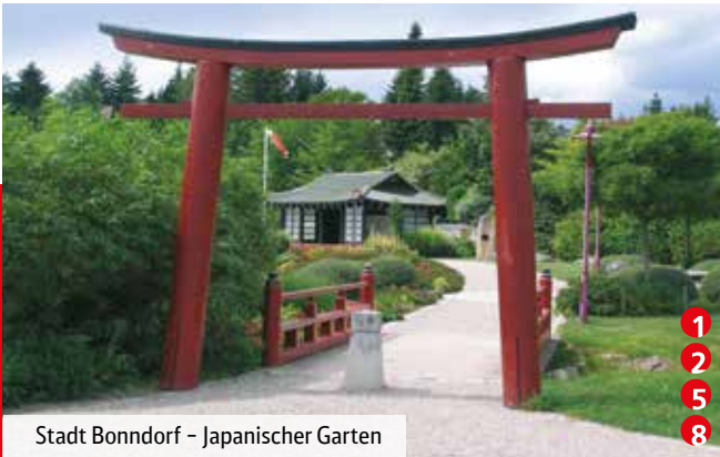
Stadt Bonndorf - Japanischer Garten