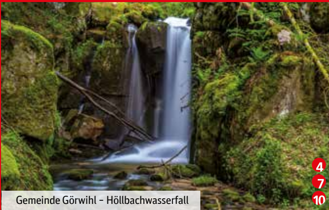
Gemeinde Görwihl – Höllbachwasserfall