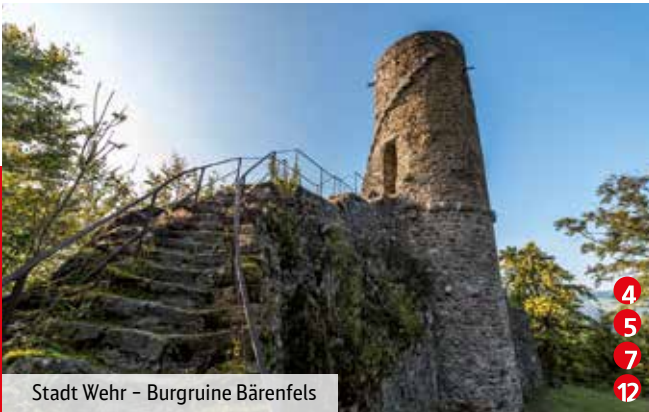
Stadt Wehr – Burgruine Bärenfels